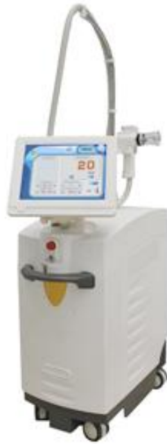
Эрбиевый фракционный лазер 1550A

Эффективен для борьбы с любыми косметологическими дефектами кожи – морщины, растяжки, шрамы, рубцы, пигментные пятна, мелазма, целлюлит, увядающая кожа, постакне. Проведение процедуры комфортное и безболезненное, без восстановительного периода и побочных эффектов.