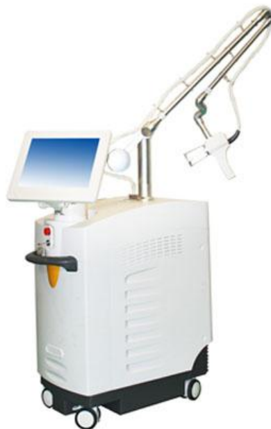
CO2 (Углекислый) фракционный лазер XS 10660A

Эффективен для борьбы с любыми косметологическими дефектами кожи – морщины, растяжки, шрамы, рубцы, пигментные пятна, мелазма, целлюлит, увядающая кожа, постакне, различные новообразования – невусы, бородавки, папиломы, и.т.д.