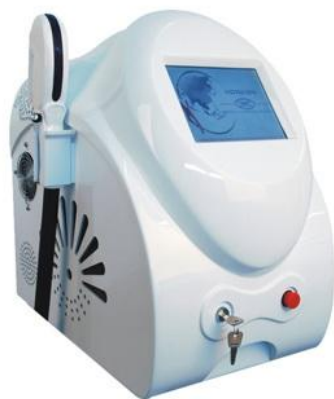
Фототерапевтический аппарат (Элос) GE

Аппарат использует современную технологию ЭЛОС( синергия RF-энергии и интенсивного света) и высокоэффективен для фотозпиляции и фотоомоложения лица , так же используется для удаления пигментации , татуировок , акне и сосудистой сетки . Комфортное безболезненное удаление любых волос за 2-3 процедуры .