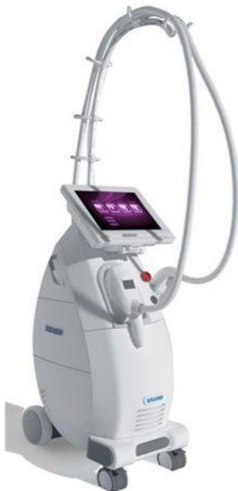
Аппарат вакуумно-роликового массажа+Элос Slimming

Аппарат имеет семь различных манипул для лица и тела .На сегодняшний день это единственный медицинский аппарат , который достигает оптимизации метаболических процессов и улучшает состояние подкожно-жирового слоя благодаря глубокому проникновению RF-энергии и инфракрасного излучения , аппарат высокоэфтетивен для подтяжки кожи лица и тела , а так же и моделирования фигуры .